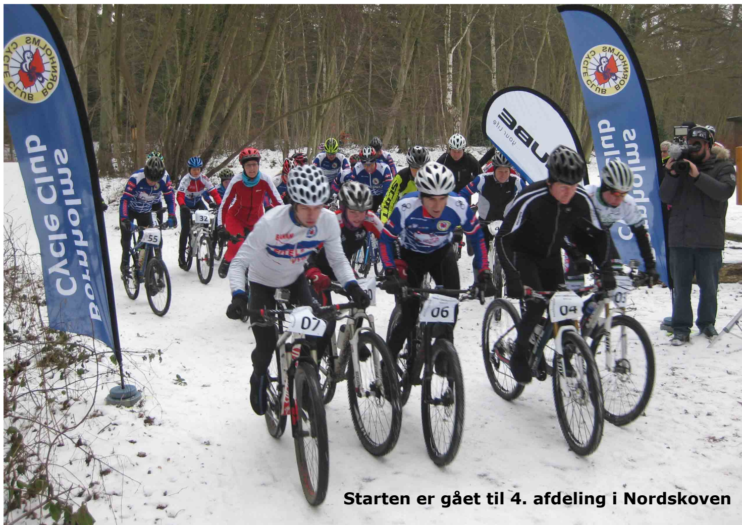
Starten er gået til 4. afdeling i Nordskoven

I dette nr. kan du se resultaterne fra 3. og 4. omgang samt en opdaterer stilling af MTB-cuppen på siderne 8-11.