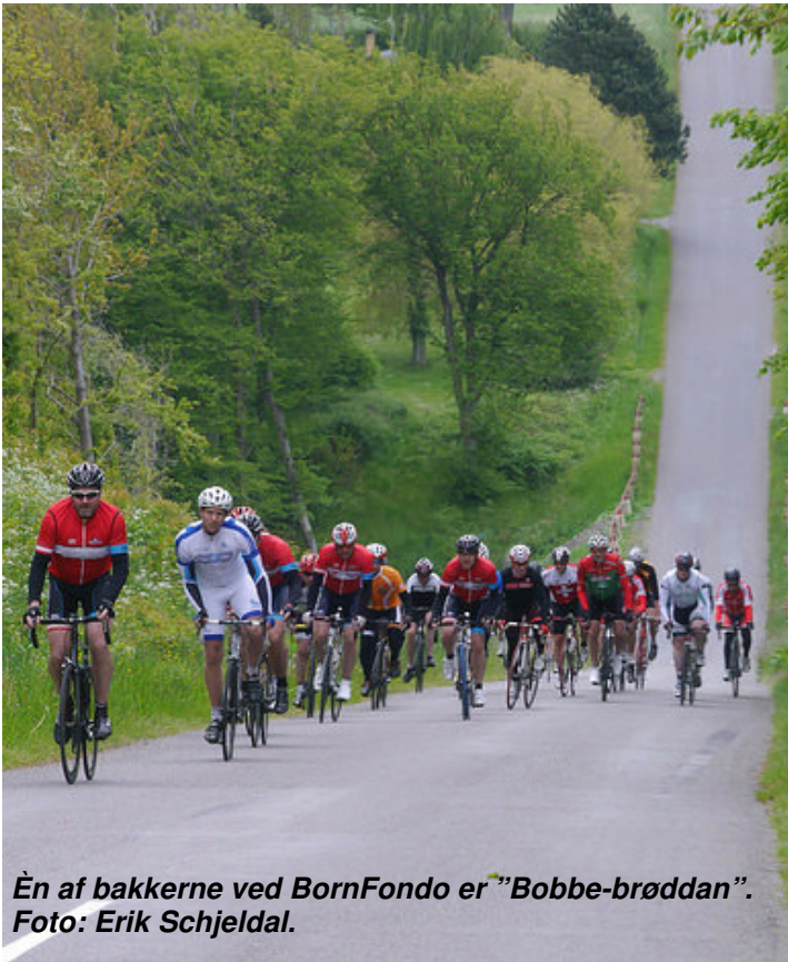
En af bakkerne ved BornFondo er "Bobbe-brøddan".

Bornholms Cycle Club arrangerer igen den nye klassiker for ambitiøse motionister i weekenden den 28.-29. maj 2016.