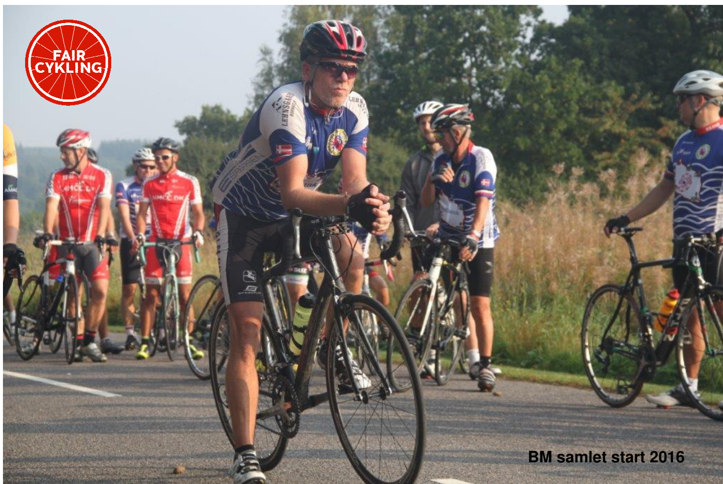
BM samlet start 2016