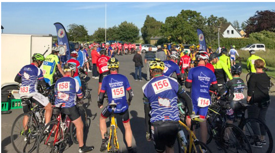
Klar til start. En del af BCC-erne var ikklædt klubbens nydesignede klubtøj.

Som sædvanlig var der pølser og drikkel- se efterfølgende.