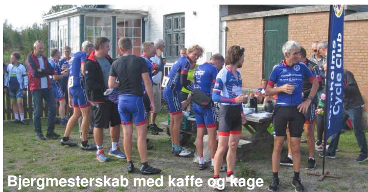
Bjergmesterskab med kaffe og kage