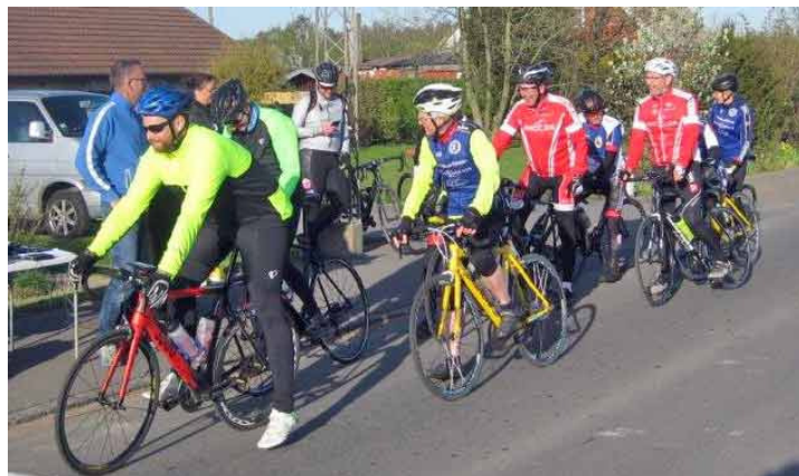
31 ryttere kørte Vestermarieløbet - foruden 10-11 motionister som kørte uden tidtagning. Et tiltag som man formentlig fremover bevarer.