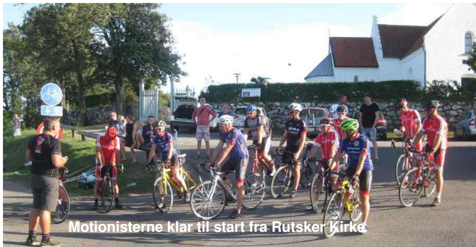
Motionisterne klar til start fra Rutsker Kirke