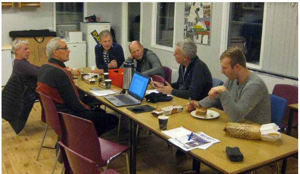
Det var en lille eksklusiv forsamling, som deltog i ryttermødet om landevejstræningen 2019.

Landevejsæsonen 2018 er knap nok færdig, før sæsonen 2019 skal planlægges!