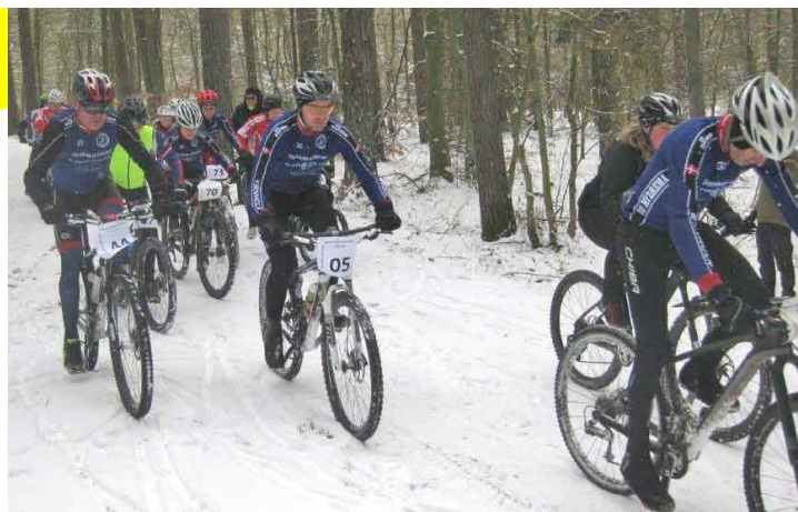
5. afdeling af MTB-Cuppen 2017/2018 var den eneste med sne i sporet. - med mindre det sker igen d. 29 december.

De 8 landevejsløb var Indledningsløbet, Vestermarieløbet, Born Fondo lørdag og søndag, Lehnsgaard Motion, Soldalsløbet, Bjergmesterskabet, samt BM enkeltstart.