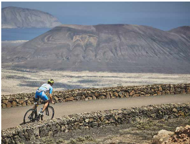
Et noget anerledes landskab end hvad vi er vant til.