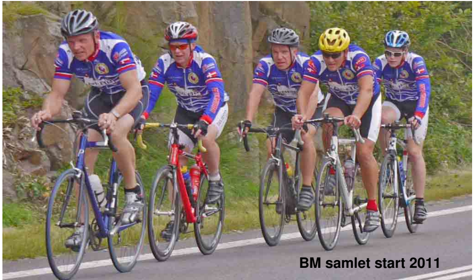
BM samlet start 2011