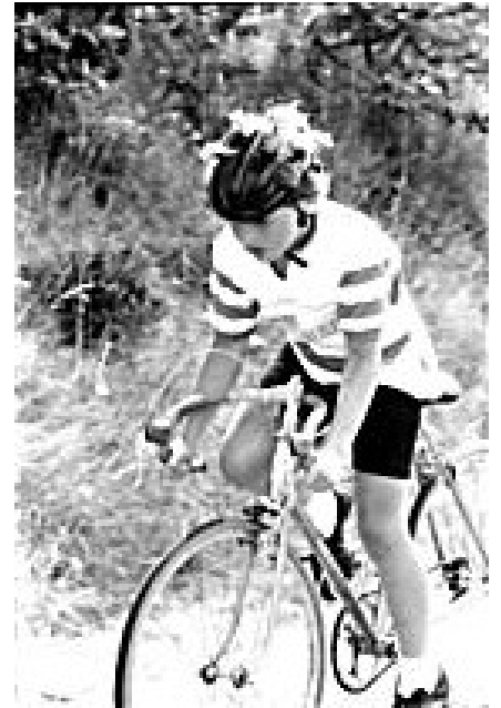
Med lidt god vilje kan man godt se, at en drengerytter i Bjergmesterskabet 1970 kun har ét gear på cyklen.