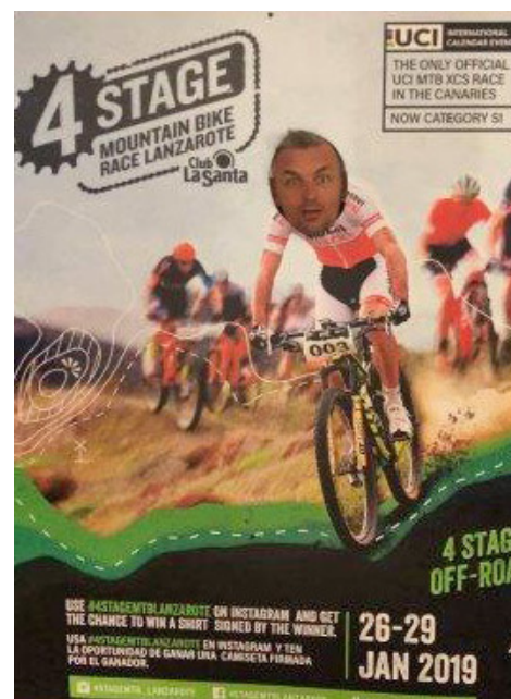
Ikke kun hårdt arbejde hele tiden ...