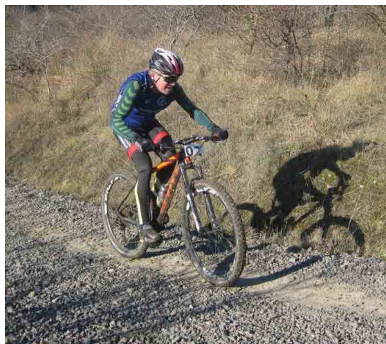
Foto fra 5. afdeling MTB-CUP.