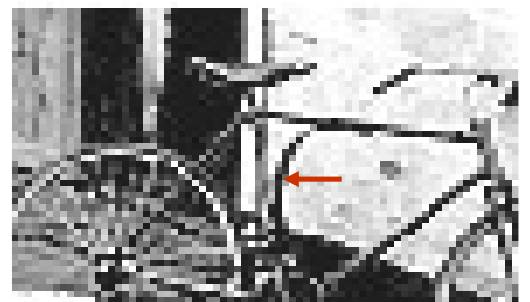
Ja, der kunne deltagerne i VM lære noget ...

Det var en ganske almindelig cykel, som den gang vejede mindst 20 kg.