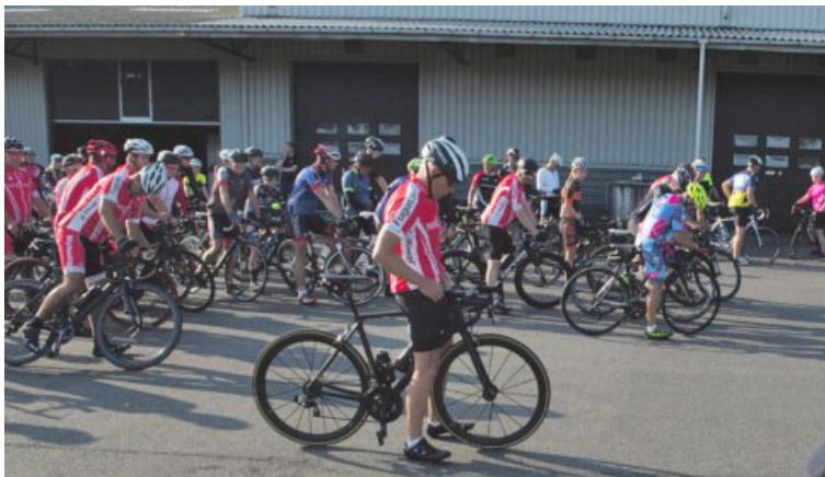
"Er I klar"?

Det syvende Lehnsgaard og HYDREMA Motionsløb i streg var (igen) begunstiget af supermotionscykelvejr. Denne gang mødte i alt 75 ryttere frem - heraf 15 piger/kvinder - for at køre enten den korte rute på 32 km eller den længere på 44 km.