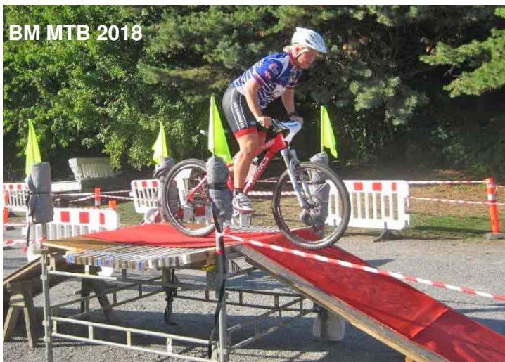
BM MTB 2018