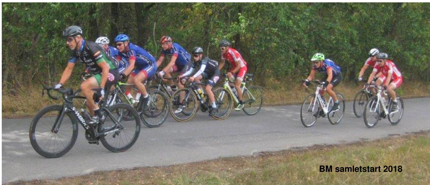
BM samletstart 2018