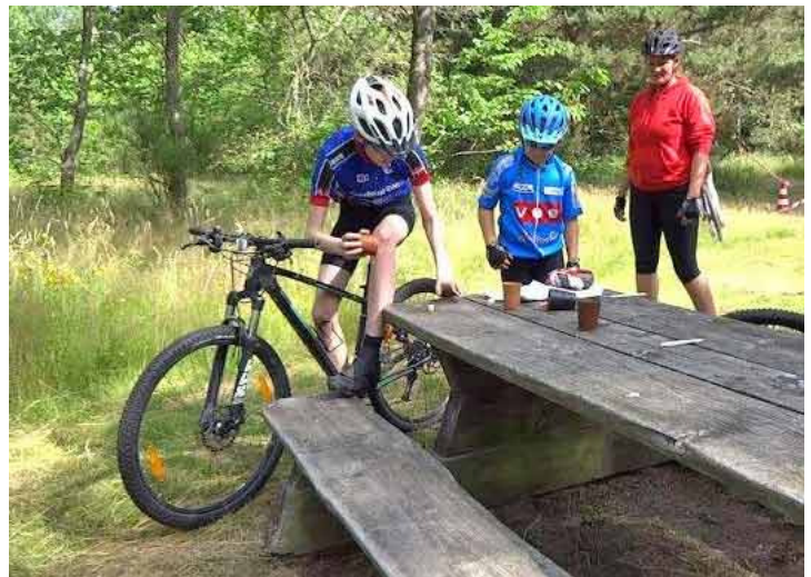
Så slå nu lige den 6'er ...