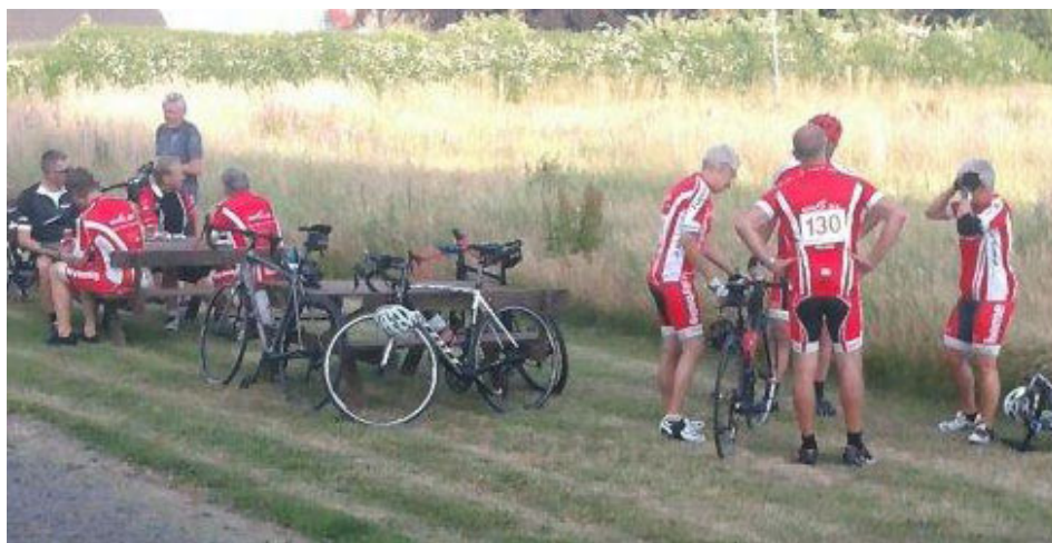
Nexø Motion cykel Club deltog med et stort kontingent deltagere.