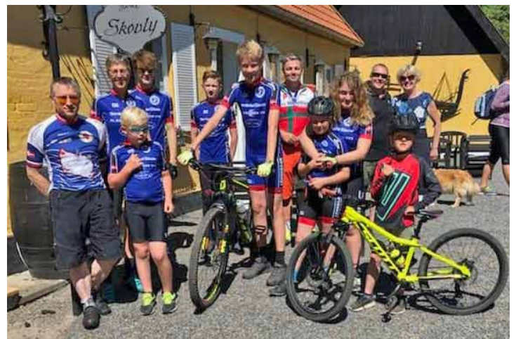
16 stk m/k i alle aldre besøgte klubbens trofaste sponsor, Hotel Skovly efter vor MTB-træning. Vi ønsker dem en travl sommer på hotellet og tusind tak for de altid åbne arme - og tak for is og kaffe!