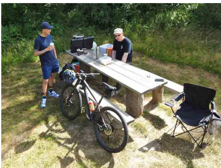
Tid til frokost.