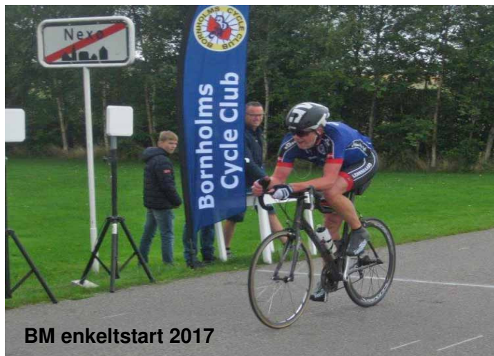
BM enkeltstart 2017