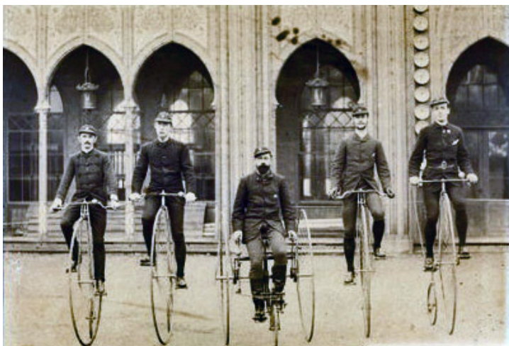
Cykelryttere på "væltepetere" i Tivoli.

I referaterne bemærker man, at banens beskaffenhed var i ringe stand. Den var bakket, ujævn og med bratte sving.