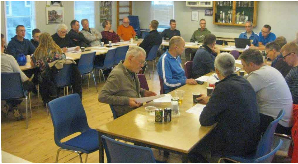
29 medlemmer deltog i årets generalforsamling

tagne opfordringer fra bestyrelsen om dette, så er der altså et "vist forbedringspotentiale" til stede her.