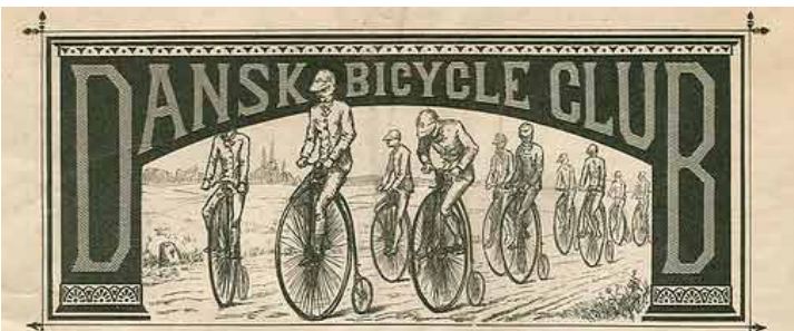
Dansk Bicycle Clubs 4de aarlige Væddeløb i Tivoli

Skribenten fra Bornholms Tidende begyndte i sit referat at harcelere over, at han skulle betale entré – hvilket man nok kunne holde med ham i: "For betaling af 35 øre pro Persona fik også avisreferenterne lov til at se Bornholms Cycle Club køre om kap. At foreninger viser pressen lidt opmærksomhed for ydet assistance