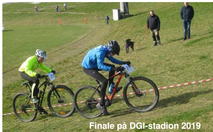
Finale på DGI-stadion 2019

For de helt unge kan der kun blive spænding i U-11 og U13 - hvis vore venner fra Christiansø, Birk og Halfdan Øe tager turen til Bornholm!