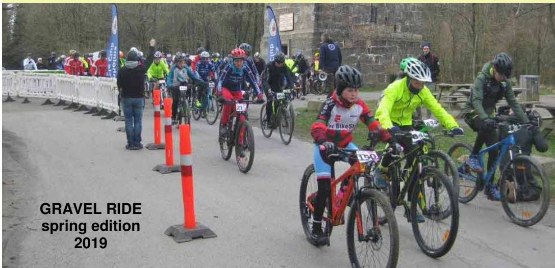
GRAVEL RIDE spring edition 2019

Registrering og tilmelding foregår på dagen fra kl. 08.30 og starten går kl. 10.00. så husk at komme i god tid. Prisen for hele herligheden er 50,- kr. Efter endt race er det vigtigt at aflevere startnummeret igen, da der er masser af lodtrækningspræmier fra vore sponsorer.