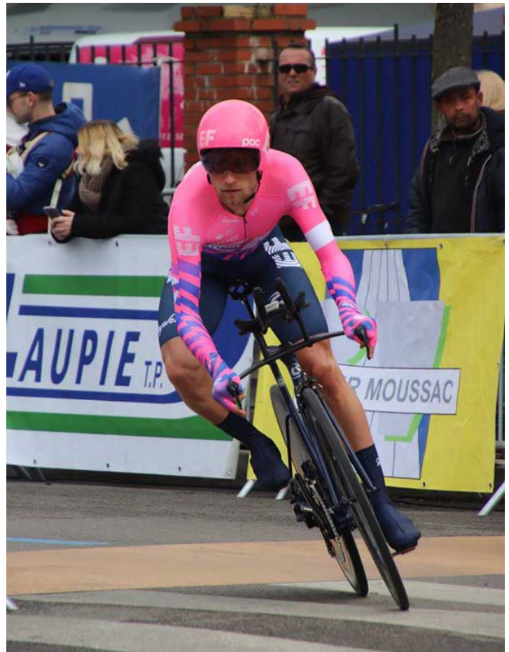
Magnus bliver nr. to på enkeltstarten.

De italienske forårsløb er desværre blevet aflyst, og EF