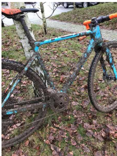
Denne cykel var engang Asgers crosscykel ved DM ...