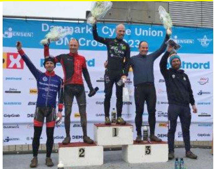
Asger nr. 5 i motionsklassen (m/k)

Vil lige tilføje, nu hvor A-B-rytterne har kørt, at min tid