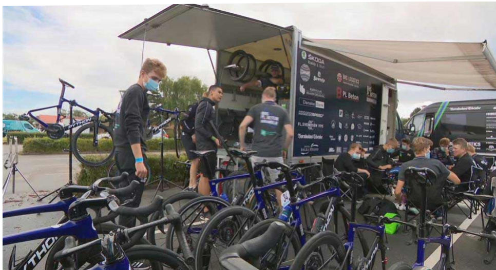
BHS-PL Beton Bornholm til DM 2020 i linjeløb.

Det er selve organisationen, der er interessant, når vi taler BHS-PL Beton. Den struktur, der er bygget op, som tiltrækker og fastholder talenter. Træningsprogrammer og selvfølgelig