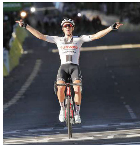
Søren Kragh Andersen - Årets Cykelrytter 2020 med to etapesejre - nr. 14 og 19 i Tour de France.