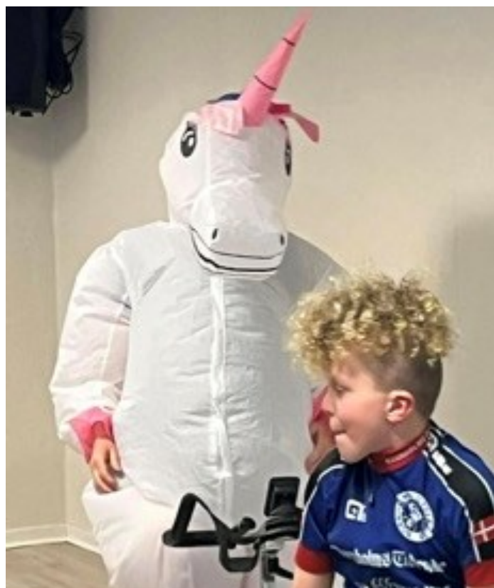
Der var også altid plads til fis sjov og ballade.