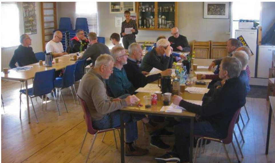
18 medlemmer til frokost, kaffe og kage. Og ikke mindst generalforsamling.

Mange havde efterlyst spinningsmuligheder under sidste vinters nedluk-