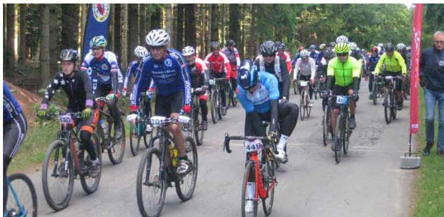
Foto fra starten af Gravel Ride 2019 autumn edition med lige godt 100 ryttere.

Registrering og tilmelding foregår på dagen fra kl. 8.30 og starten går kl. 10.00, så husk at komme i god