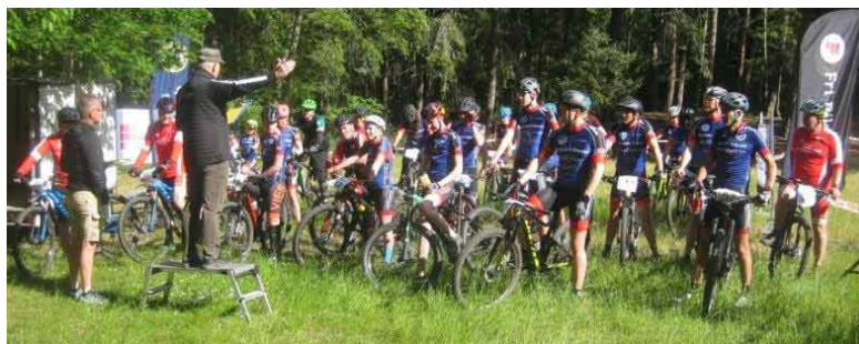
Foto fra MTB-CUP i Sjælsmyre i et flot solskinsvejr.

Prisen for at deltage inkluderer kaffe og kage på Hotel Skovly.