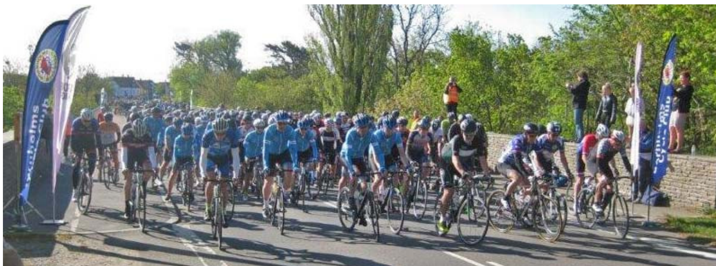
Foto fra starten på Bjergløbet i 2017 i fuld solskin og uden Coronarestriktioner. Godt 520 morgenduelige ryttere stillede til start hvoraf de 378 fuldførte alle fire omgange. Måtte vi blive mindst lige så mange i år ...

Born Fondo indledes med Bjergenkeltstarten fra Vang havn til Hammerfyret lørdag, den 21. maj med. Dagen efter om søndagen den 22. maj gælder det Bjergløbet med start og mål i Gudhjem.