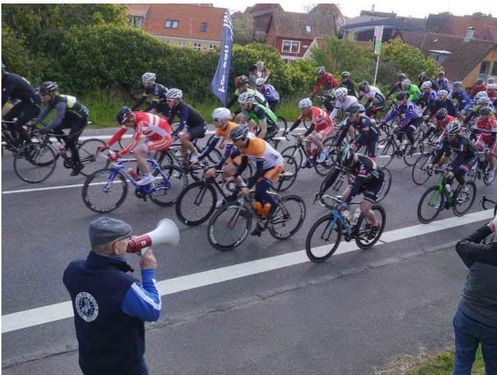
Go´ tur og pas godt på jer selv og alle de andre...