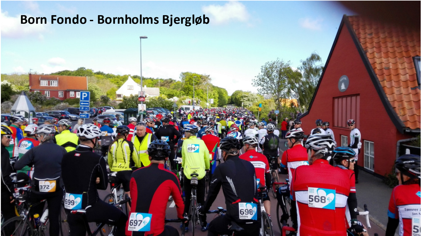
Cykelryttere så langt øjet rækker før masterstarten ved Bornholms Bjergløb.

Lidt at et sommerferienummer denne gang!