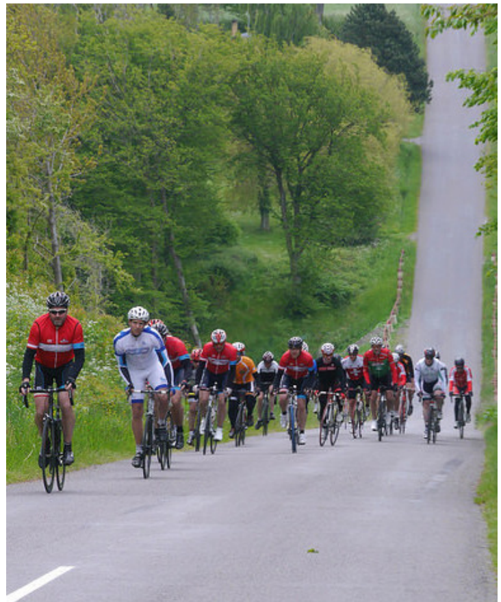
Bobbabrøddan indbyder altid til spektakulære fotos.