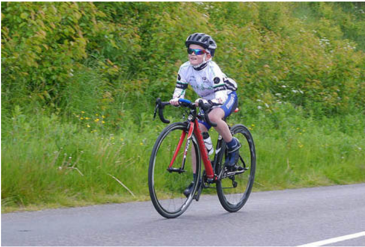
Var denne unge mand yngste rytter i Bjergløbet - og nåede han rundt alle fire omgange?