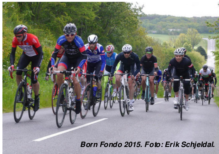
Born Fondo 2015.

Vi vil fortælle om arbejdet og organiseringen med Born Fondo-w eekenden - samt om de indvundne erfaringer med et sådant stort arrangement - med henblik på at vi til næste år formentlig ud over Born Fondo 2016 også skal stå