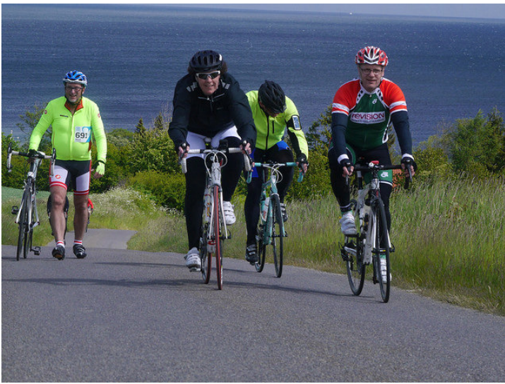
Fra havet og lige op i himlen. Ikke alle klarede den opstigning lige godt...