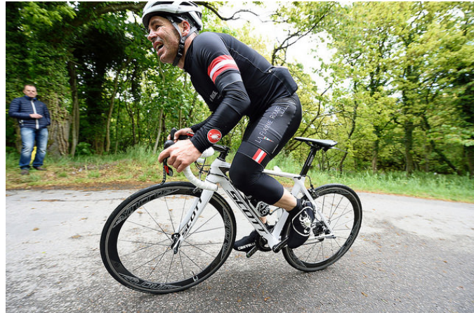
Ren smerte på Fyrvej...