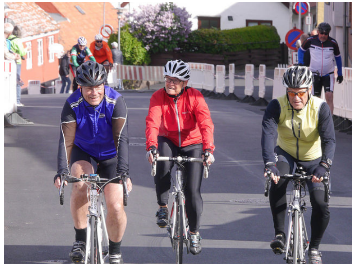
Tre gæve motionister sled sig op ad Brøddegade 2, 3 eller måske 4 gange...