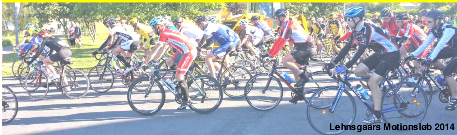
Lehnsgaars Motionsløb 2014