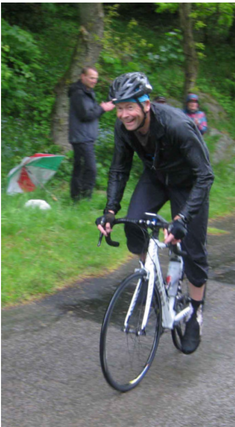
Der var ryttere, som kunne smile på de sidste 50 m af lørdagens bjergenkeltstart...