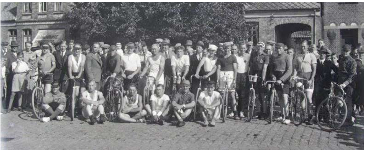
1935. Cyklerne begynder at ligne den tids racercykler.