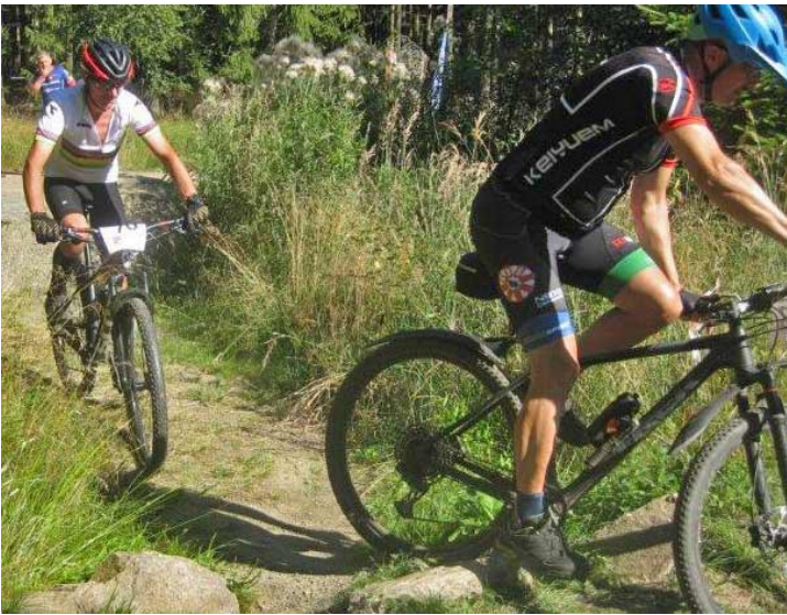
Sporet var krydret med flere snævre og trikie passager, som satte rytternes teknik på prøve.