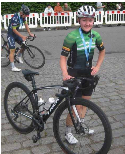
Første kvinde i mål.