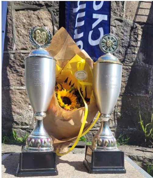
De to mesterskabspokaler.

F or mig som klubmand har det lokale mesterskab på øen altid været en stor ære og prestige at få lov at være en del af, omend det så nu kun er som arrangør er det stadig kæmpe stort!