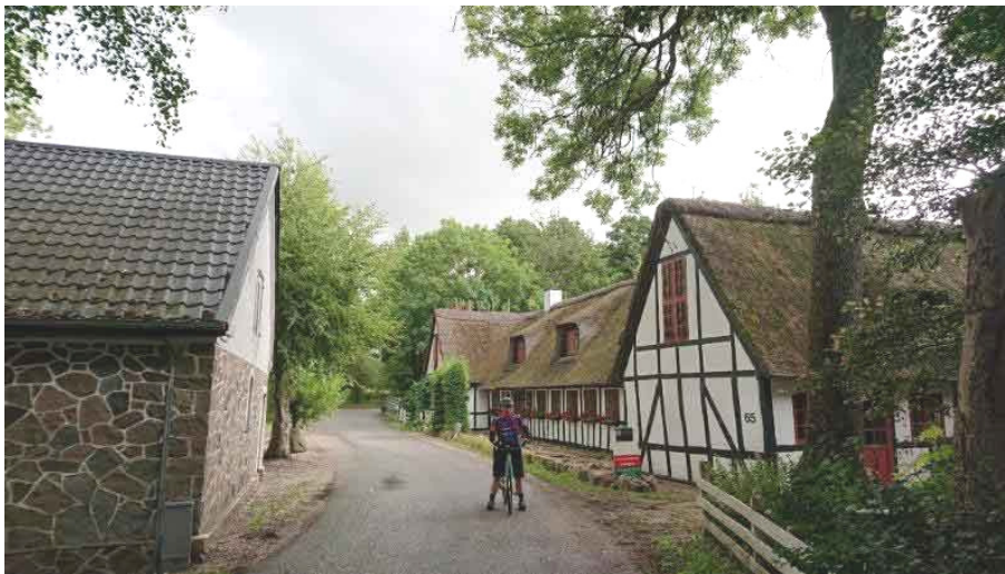
Den rene idyl i Jylland.