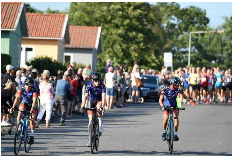
Ved starten på Torneværksvej står publikum tæt, og BCC-folkene påser, at folk holder sig på fortovet ...