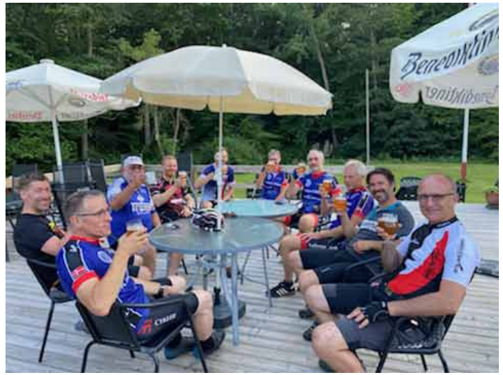
Foto fra tirsdag, den 13. juli med 10 deltagere.