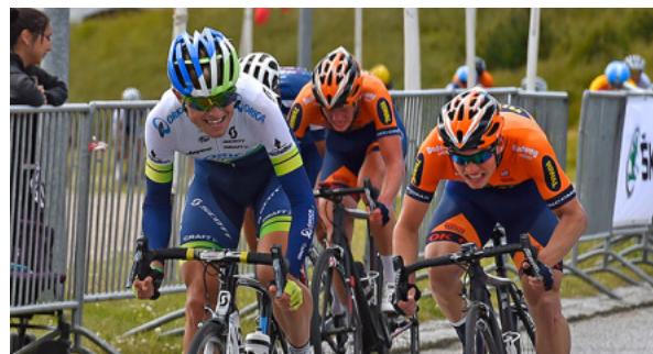
--- hvorefter han også vinder 3. afdeling af Post Cuppen.

Der bliver spændende om Magnus formår at tilkæmpe sig en plads på holdet. I hvert fald ønsker BCC-NYT ham held og lykke.