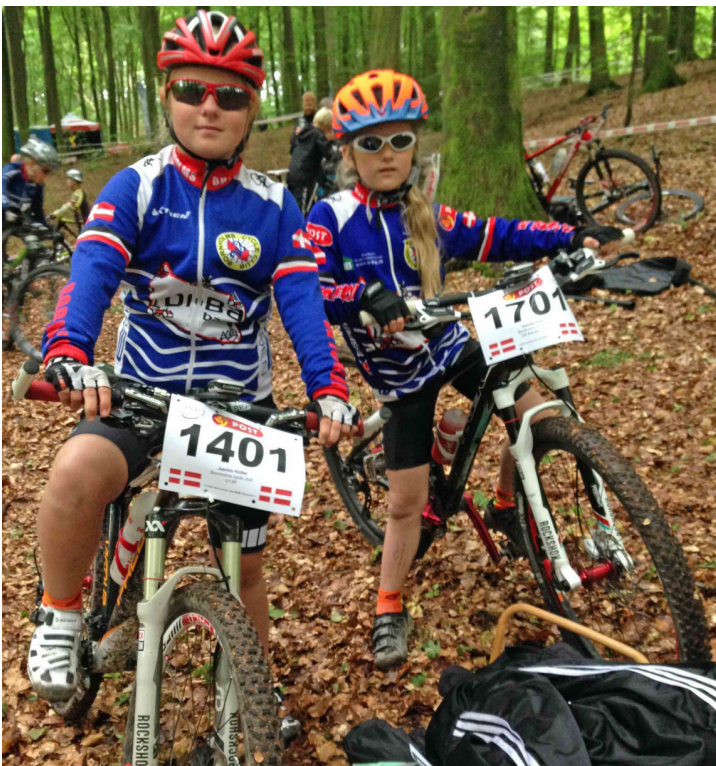
Frisk mod før start