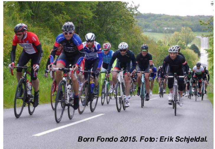
Born Fondo 2015.

Vi vil fortælle om arbejdet og organiseringen med Born Fondo-w eekenden - samt om de indvundne erfaringer med et sådant stort arrangement - med henblik på at vi til næste år formentlig ud over Born Fondo 2016 også skal stå