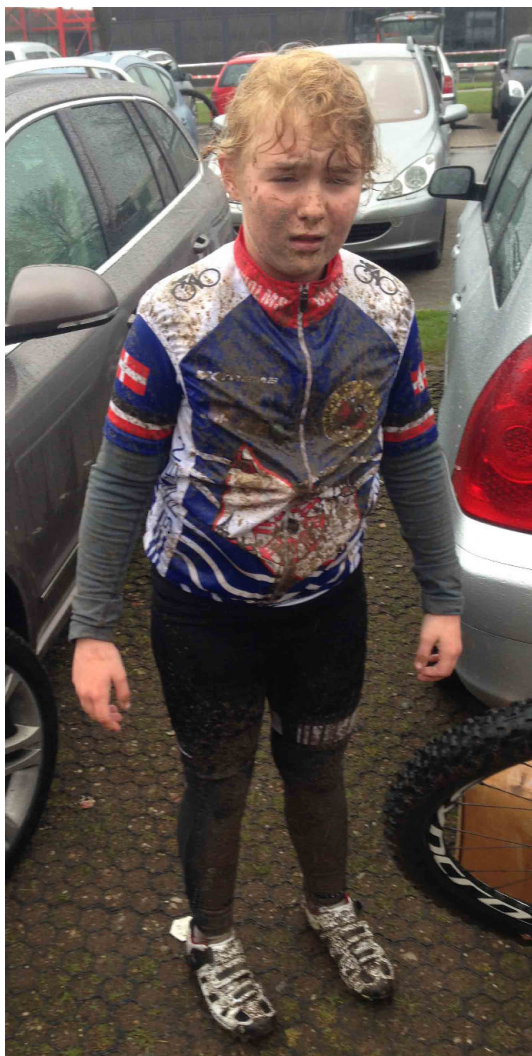
Så var det heller ikke sjovere i Kolding...

lå hun fint placeret på en 4. plads i kraft af hendes teknik. Men teknik er ikke alt, og på den stærkt kuperede rute måtte hun hurtigt overgive sig og lade sig falde helt tilbage i det 8 mand (pige) store felt! Der blev hun resten af løbet, så det var en lidt skuffet og trist pige der kom i mål og aldrig rigtig følte at hun kom i gang.