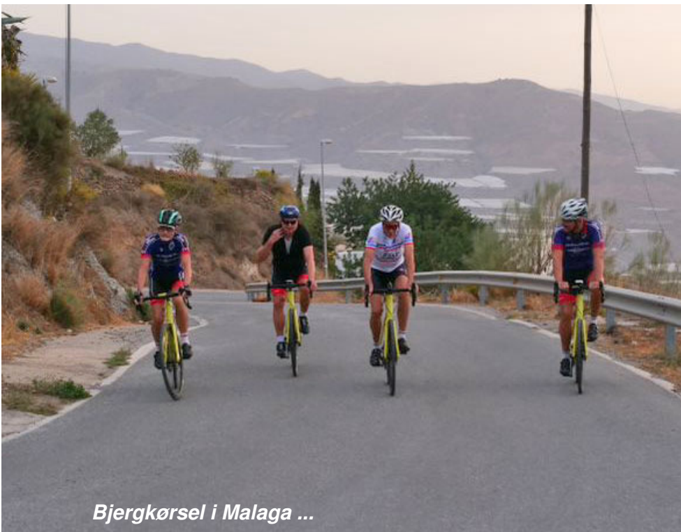
Bjergkørsel i Malaga ...