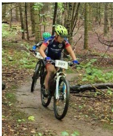
Lærke overhaler (?)