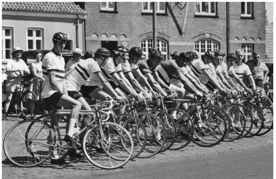
Bornholm Rundt 1960