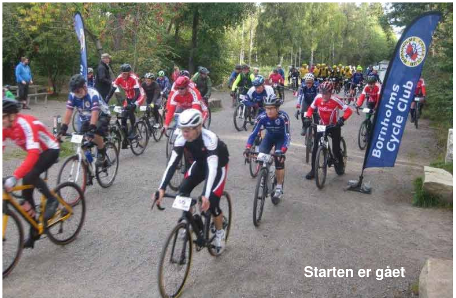
Starten er gået