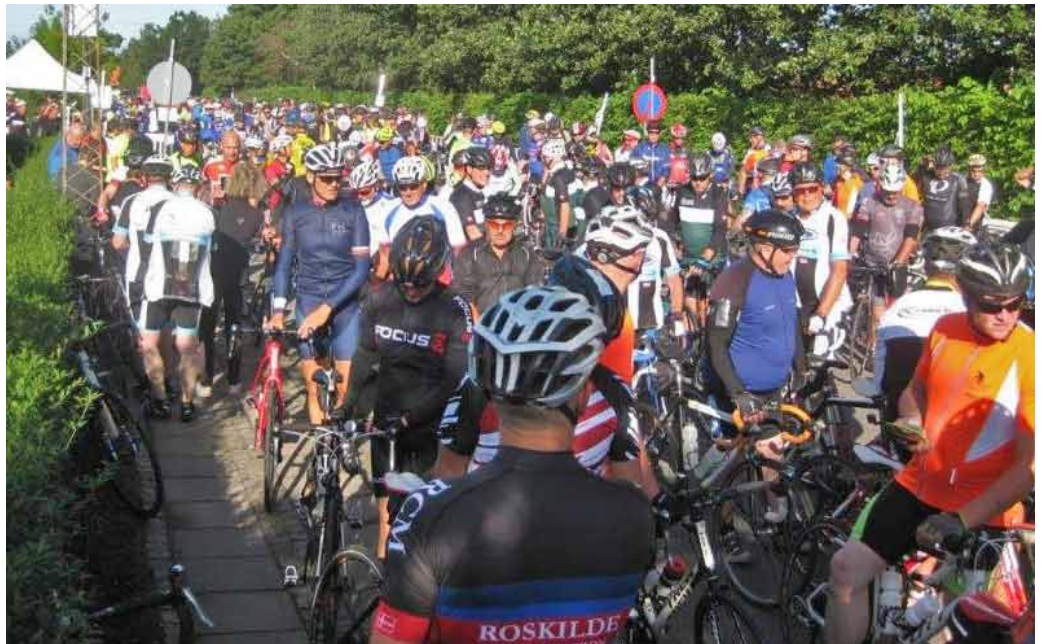
Bornholm Rundt 2017 med lidt over 1100 tilmeldte.