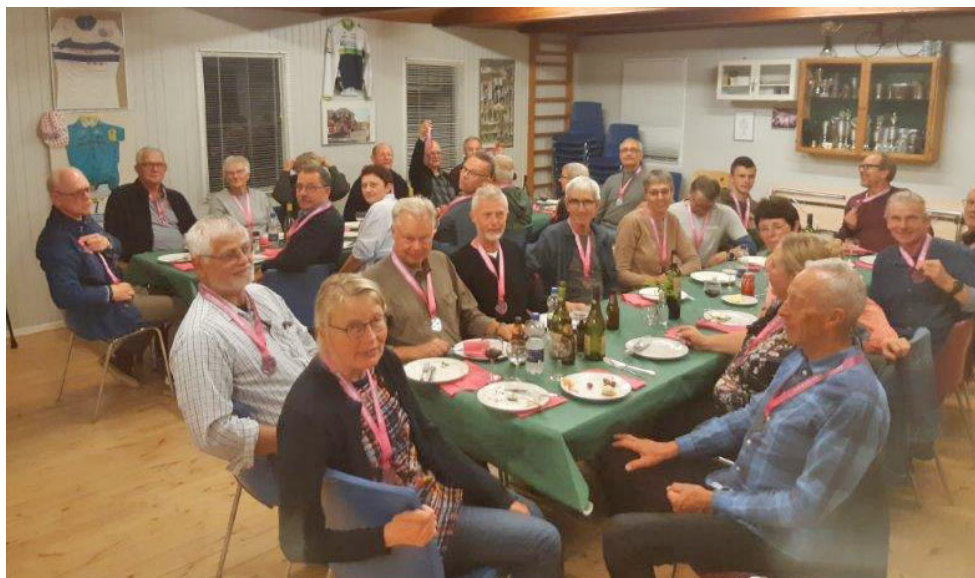
En stor del af de BCCere der hjalp til ved BornFondo i maj måned.