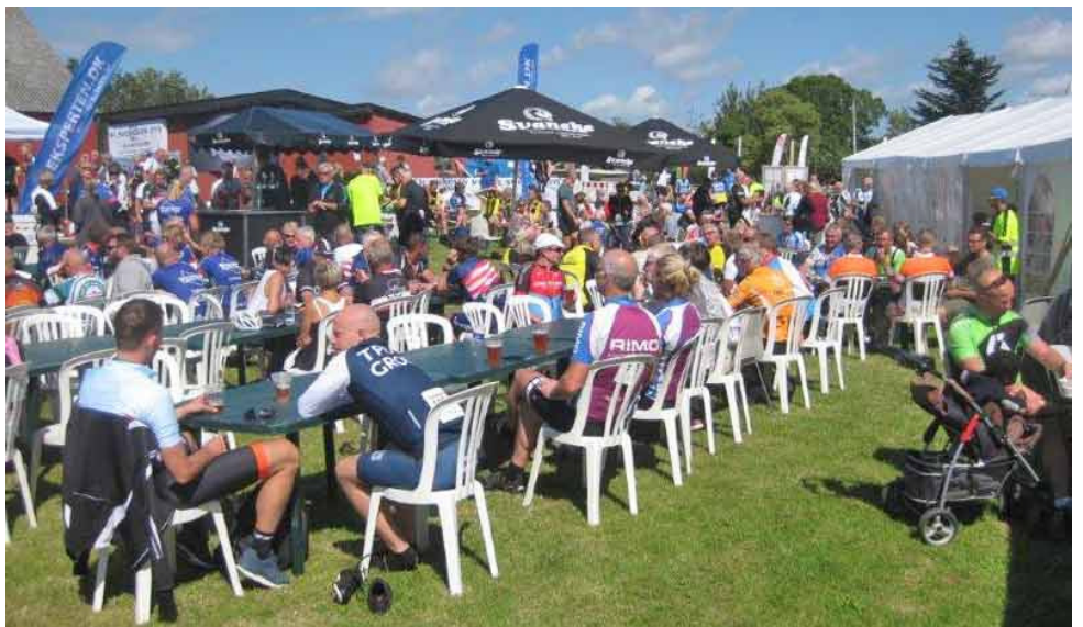
I 2017 var det flot eftersommervej, så folk hyggede sig med en øl og et par pølser.

Også i 2021 kunne man også starte om lørdagen, hvilket ca 60 personer gjorde. I alt var 1250 tilmeldte, men små 20 % dukkede ikke op - nok primært på grund af Covid 19, som stadig spøjte i baggrunden.