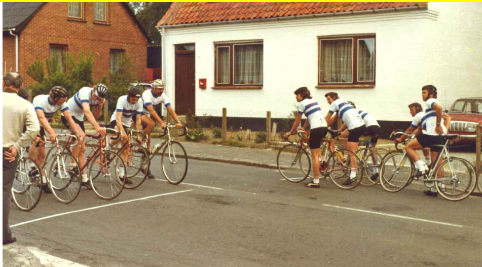
Starten på et af BCCs stjerneløb i Klemensker.

Nedenstående er et uddrag af dette referat.