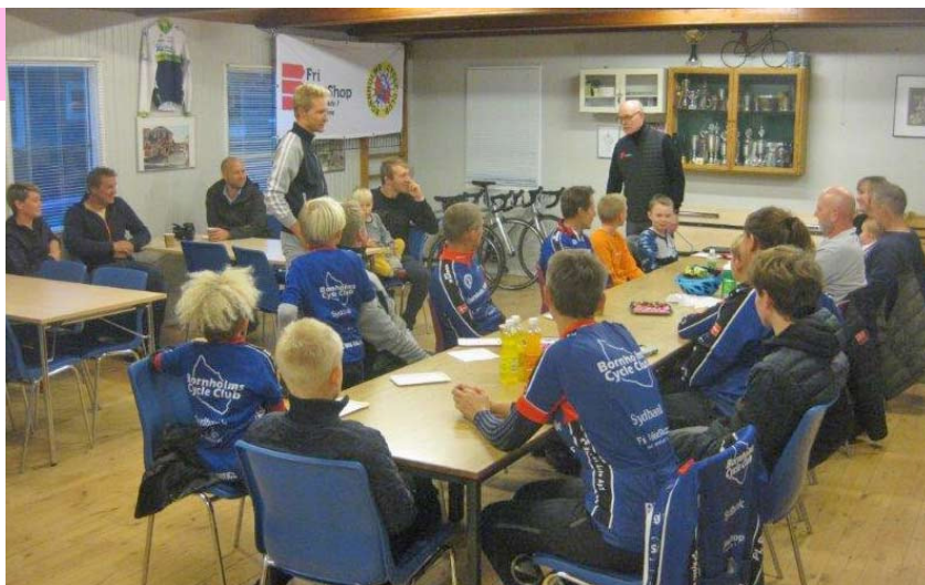
Omkring et par og tyve personer var mødt - heriblandt klubbens helt unge mountainbikere med samt forældre.

Cyklerne er ment som låncykler til klubbens projekt "cykelstræning for børn og unge", der kunne tænke sig at køre ræs, og som sættes i søen sidst på sommeren i år. Dog skal man nok være 12-14 år, før cyklerne er egnede til formålet!