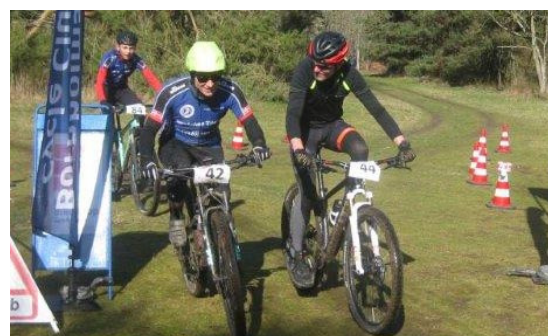
MTB-CUP nr. 5 2023

Håber vi ses d. 5 november til 1. afdeling. MTB udvalget.