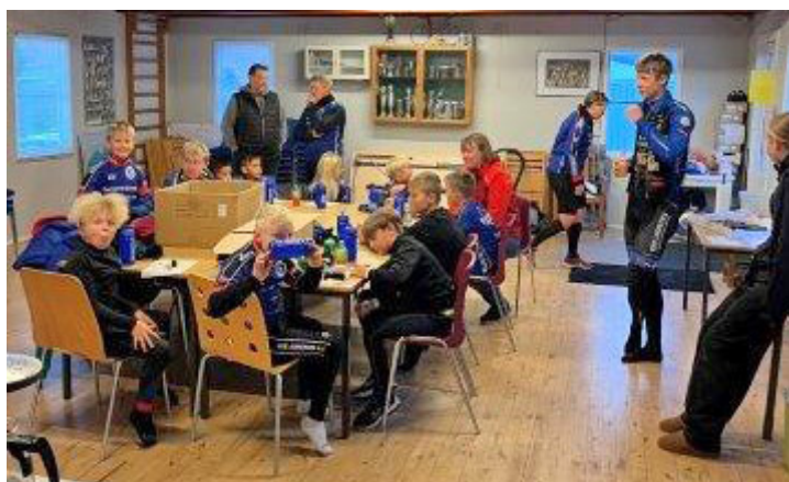
Kage og sodavand.