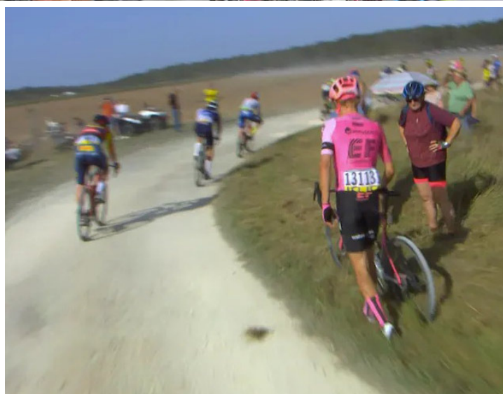
Grusstykke i Paris-Tours. Aflevering af hjul med efterfølgende punktering.

Han er kun overgået af nordmanden Alexander Kristoff, der er 36 år.