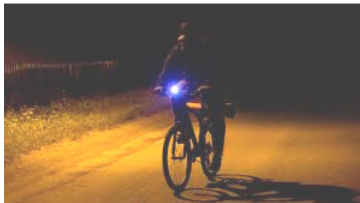
Kraftige lygter er nødvendige.

Onsdagstræningen på mountainbike fortsætter hele vinteren fra klubhuset kl. 18.30, hvor vi hovedsageligt kører på større skovstier, og alle er velkomne.