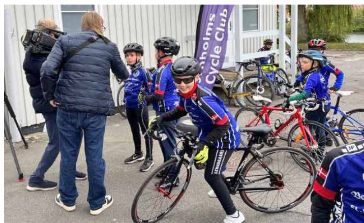
TV2 Bornholm laver indslag til aftenudsendelsen.