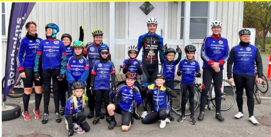
8 drenge, en enkelt pige og fem trænere/forældre sat Asger.

Vi glæder os til at fortsætte de sjove og givende træninger nu bare indendørs i stedet. Her håber vi fortsat at være vidne til et helt unikt fællesskab og opleve de kammeratskaber børnene danner på tværs af alderstrin, skolegang og hvor børnene nu engang er geo-